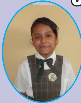
NARVASTA URBANO Estrella